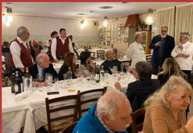
Ristorante Torinese di Rivodora

L'idea alla base con questo progetto è perciò quella di trasformare Baldissero, cambiarle faccia attraverso un grande momento di festa e di cibo, portando il piccolo ma grande Comune a diventare un vero e proprio punto