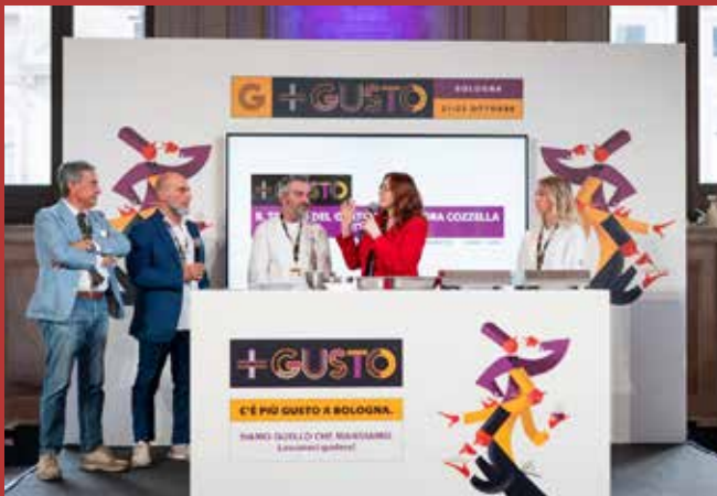
Salone C'è + Gusto di Bologna