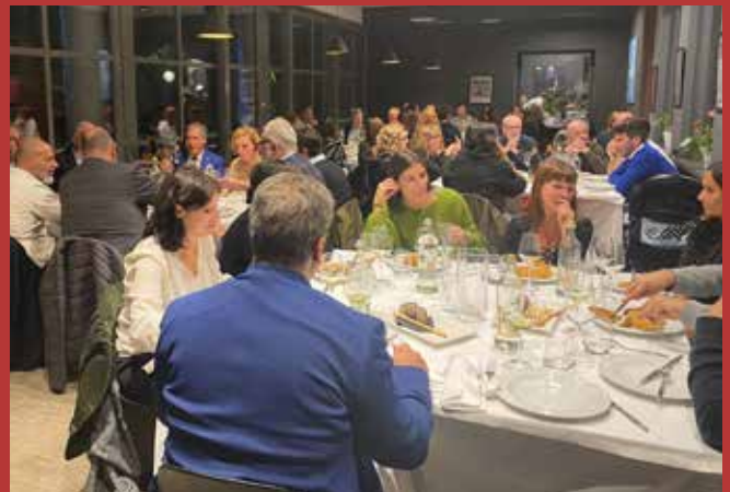
Circolo della Stampa Sporting di Torino