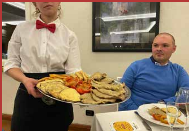
Ristorante Da Esterina