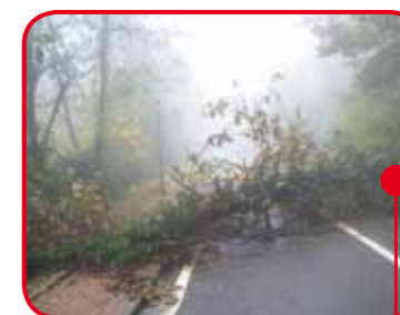
Via Superga, zona Paluc.