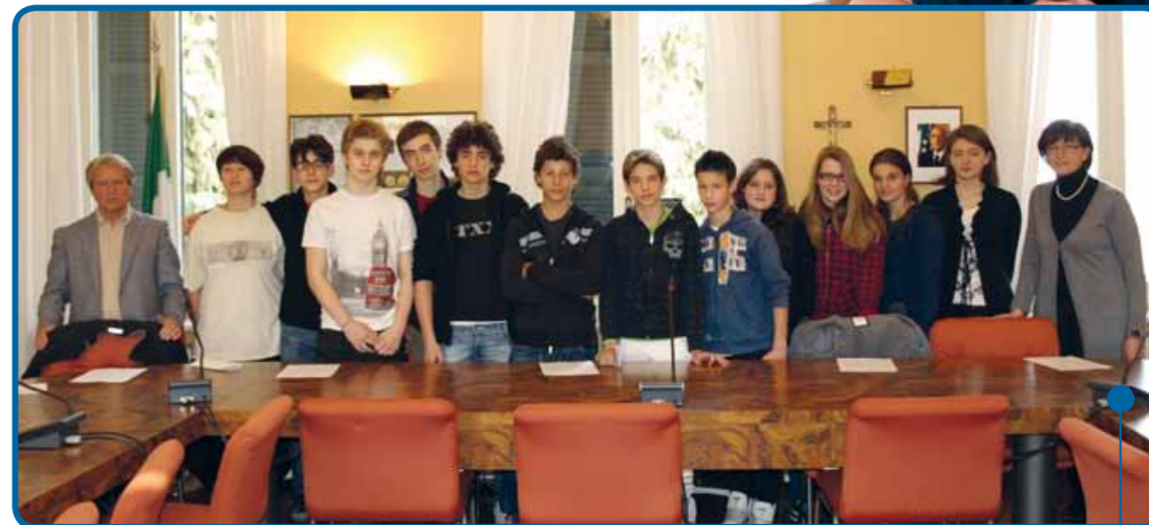
I nostri nuovi quindicenni.