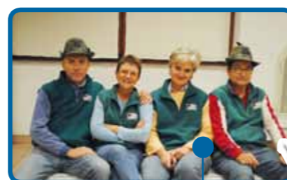
Immagini "Alpine" di una giornata da ricordare.