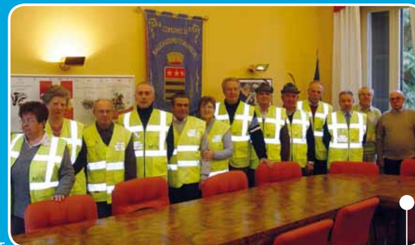
Alcuni dei nostri volontari.