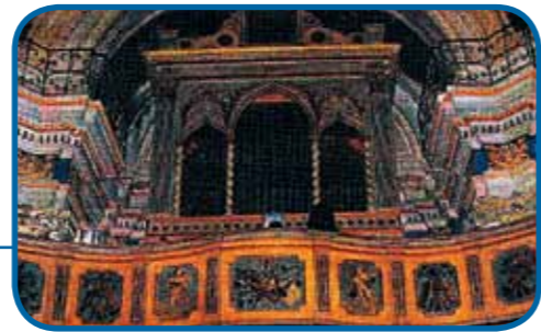
L'organo dei Bossi è del 1852 e fa bella mostra di sé nella Parrocchia di Santa Maria della Spina.