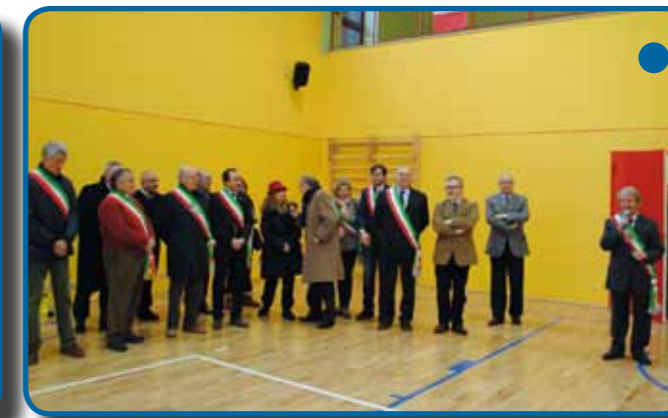
L'inaugurazione della nuova palestra comunale.