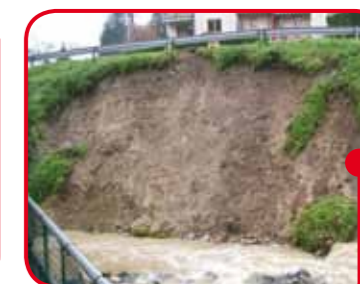
Via Torino (Rivodora)